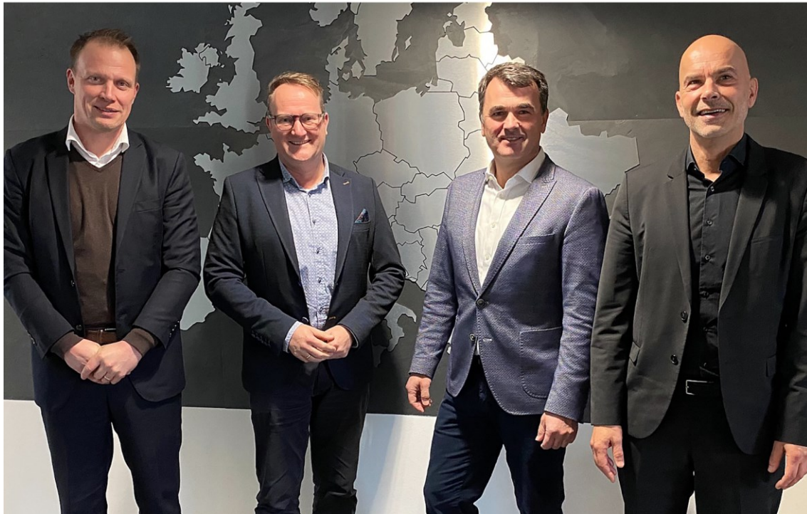
Abbildung 1: Heliatek und IGEPA group Vertreter bei der Unterzeichnung der Partnerschaftvereinbarung